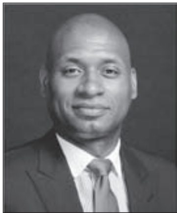
CHARLES M. BLOW